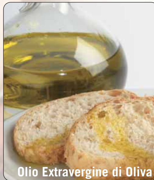
Olio Extravergine di Oliva